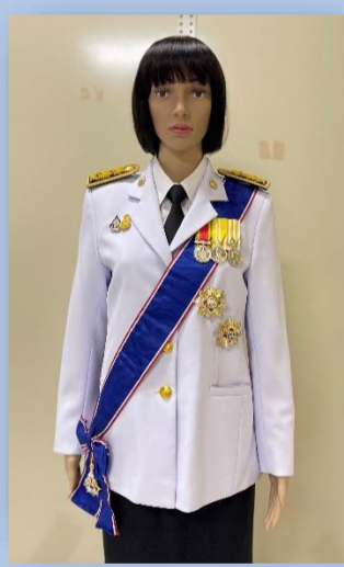
ตัวอย่างที่ ๔ ผู้ได้รับพระราชทาน ม.ป.ช. และ ม.ว.ม. (สวมสายสะพาย ม.ว.ม. และประดับดารา ม.ป.ช. ให้สูงกว่าดารา ม.ว.ม.)