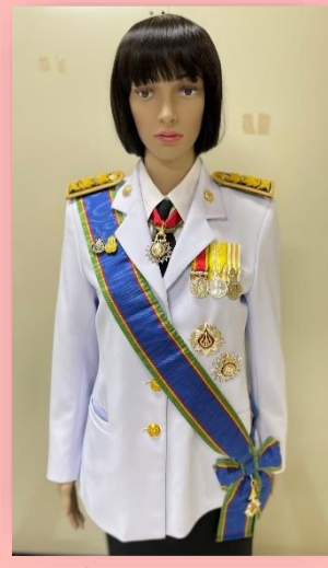
ตัวอย่างที่ ๓ ผู้ได้รับพระราชทาน ป.ม. และ ท.ช. (สวมสายสะพาย ป.ม. เนื่องจากเป็นชั้นสูงสุดที่ได้รับพระราชทาน หากไม่สวมสายสะพาย เท่ากับเป็นการแต่งกายครึ่งยศ จึงไม่ถูกต้องตามหมายกำหนดการ)