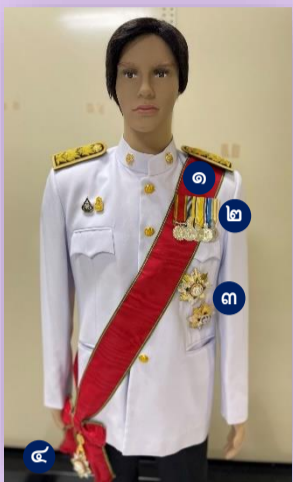
ผู้ได้รับพระราชทาน ม.ป.ช. และ ม.ว.ม.