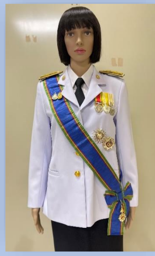
ตัวอย่างที่ ๕ ผู้ได้รับพระราชทาน ป.ช. และ ป.ม. (สวมสายสะพาย ป.ม. และประดับดารา ป.ช. ให้สูงกว่าดารา ป.ม.)