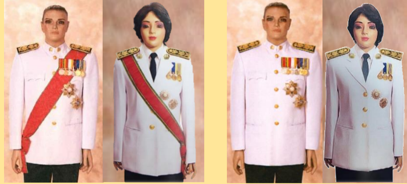
ป.ม. - ป.ช. สะพายบ่าขวา, ม.ว.ม. - ม.ป.ช. สะพายบ่าซ้าย

ชนิดมีสายสะพาย เต็มยศ ครึ่งยศ (ไม่สวมสายสะพาย)